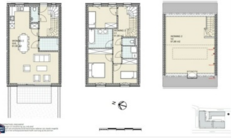
Gelidvloers, 1e verdieping, 2e verdieping