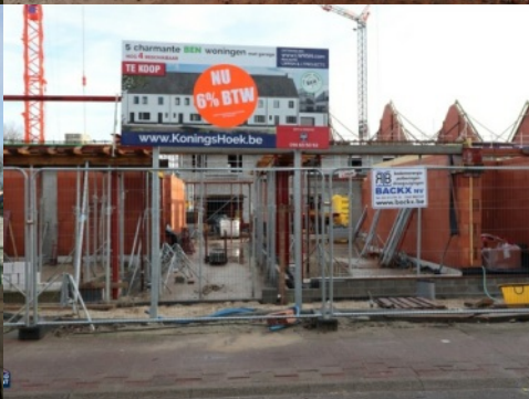
Residentie KoningsHoek Merksplas